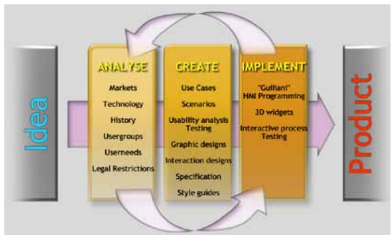
Abb. 1: Produktentwicklungs Prozess

Im Laufe der Evolution passte sich der Mensch mit allen seinen Sinnen und Fähigkeiten an eine Umwelt an, die heute nicht mehr existiert. Die weitest größte Zahl aller Menschen lebt nicht mehr im Dschungel oder in Savannen und lebt nicht alleine vom Jagen und Sammeln. Unsere hoch technisierte Welt führt daher zu neuen Herausforderungen, die der Mensch mit einem nicht passenden genetischen Setting annehmen muss. Menschen bewegen sich zu schnell, sitzen zu viel, und die Informationsdichte, die auf uns einprasselt ist hoch. Produkte werden oft entlang technischer Leitlinien entwickelt, der Mensch mit seinen Fähigkeiten, Bedürfnissen und Vorlieben wird, wenn überhaupt, erst spät im Entwicklungsprozess berücksichtigt.